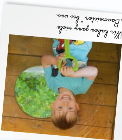
"Baumeister" bei uns. Wir haben ganz viele