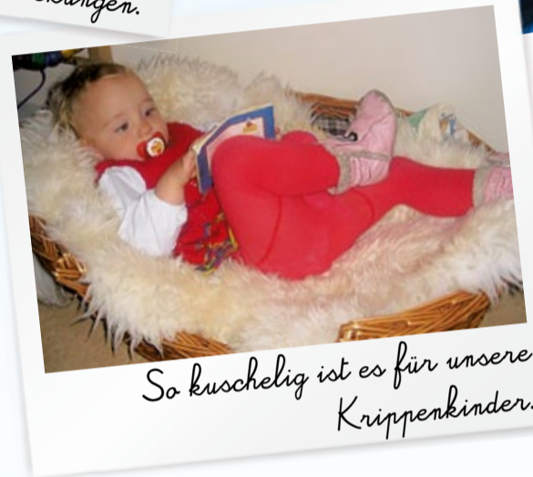
So kuschelig ist es für unsere Krippenkinder.

DAS KITA-BRÜCKENJAHR... ...garantiert gut vorbereitet in die 1. Klasse!