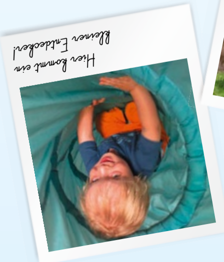
Hier kommt ein kleiner Entdecker!

Wir haben ein Motto, dem wir uns verpflichtet fühlen. Es lautet: "Ich mag dich so, wie du bist. Ich vertraue auf deine Fähigkeiten. Wenn du mich brauchst, bin ich für dich da. Versuch' es erst einmal selbst."