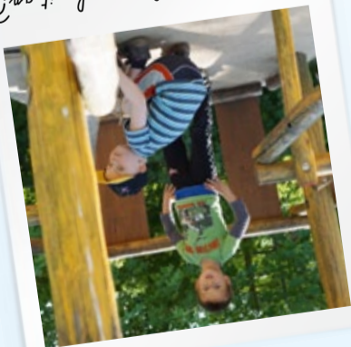
Packst du bitte mal mit an?