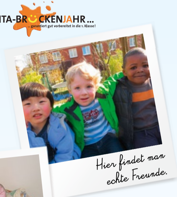
Hier findet man echte Freunde.