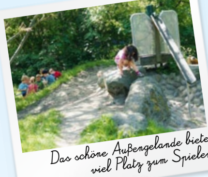
Das schöne Außengelände bietet viel Platz zum Spielen.