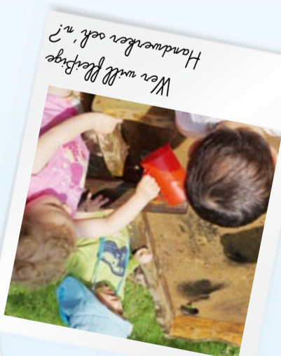
Wer will Wasser? Handwerker sehr "r"?