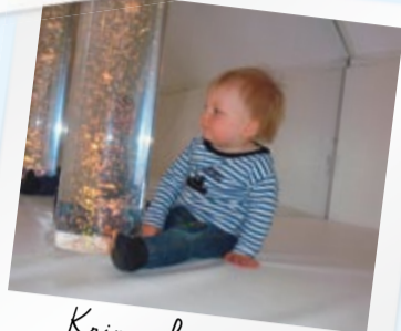
Krippenkinder sind ganz herzlich willkommen.