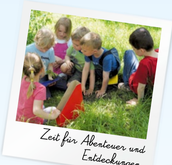
Zeit für Abenteuer und Entdeckungen.

Wir öffnen unsere Tür für Sie nach Bedarf ab 5.30 bis 22.00, auch samstags mit individueller Nutzung Ihrer Betreuungszeit.