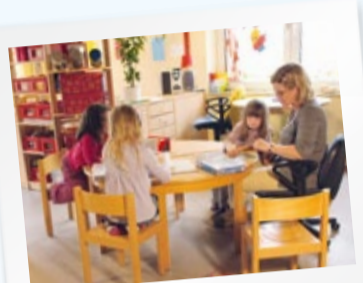
Wir haben viele helle und freundliche Räume.